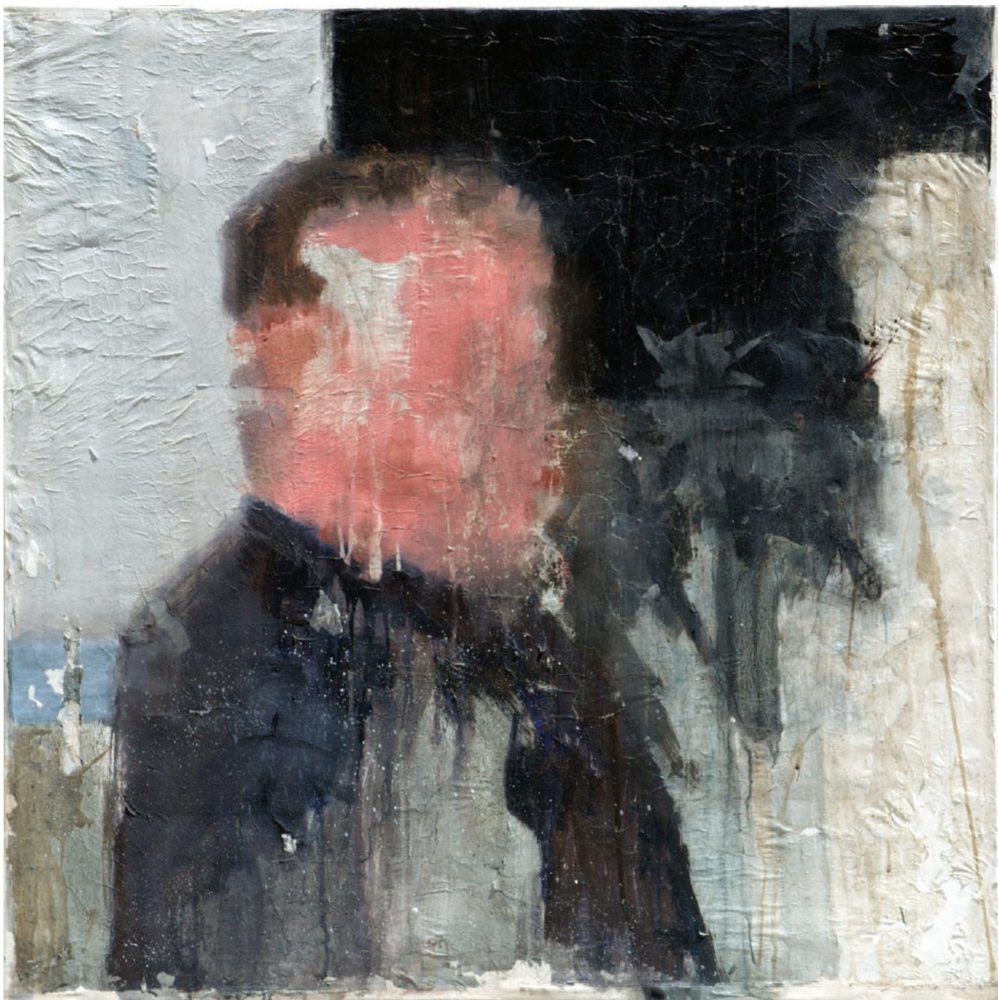
Figura (condannato), 2008, olio su carta intelata, cm 120x120