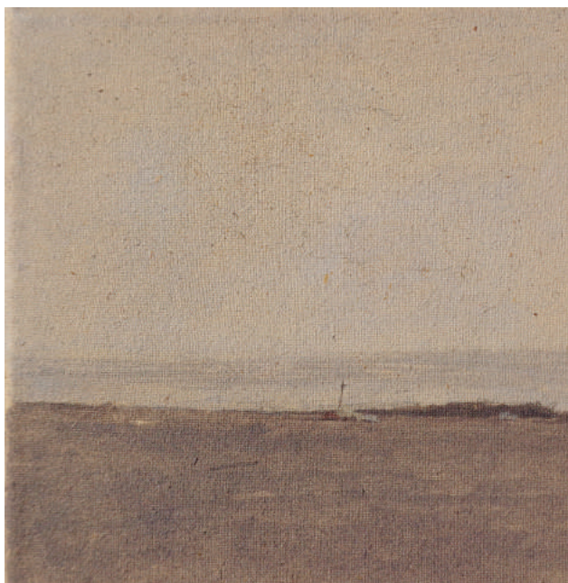
Marina, 2016, olio su tela, cm 15x15