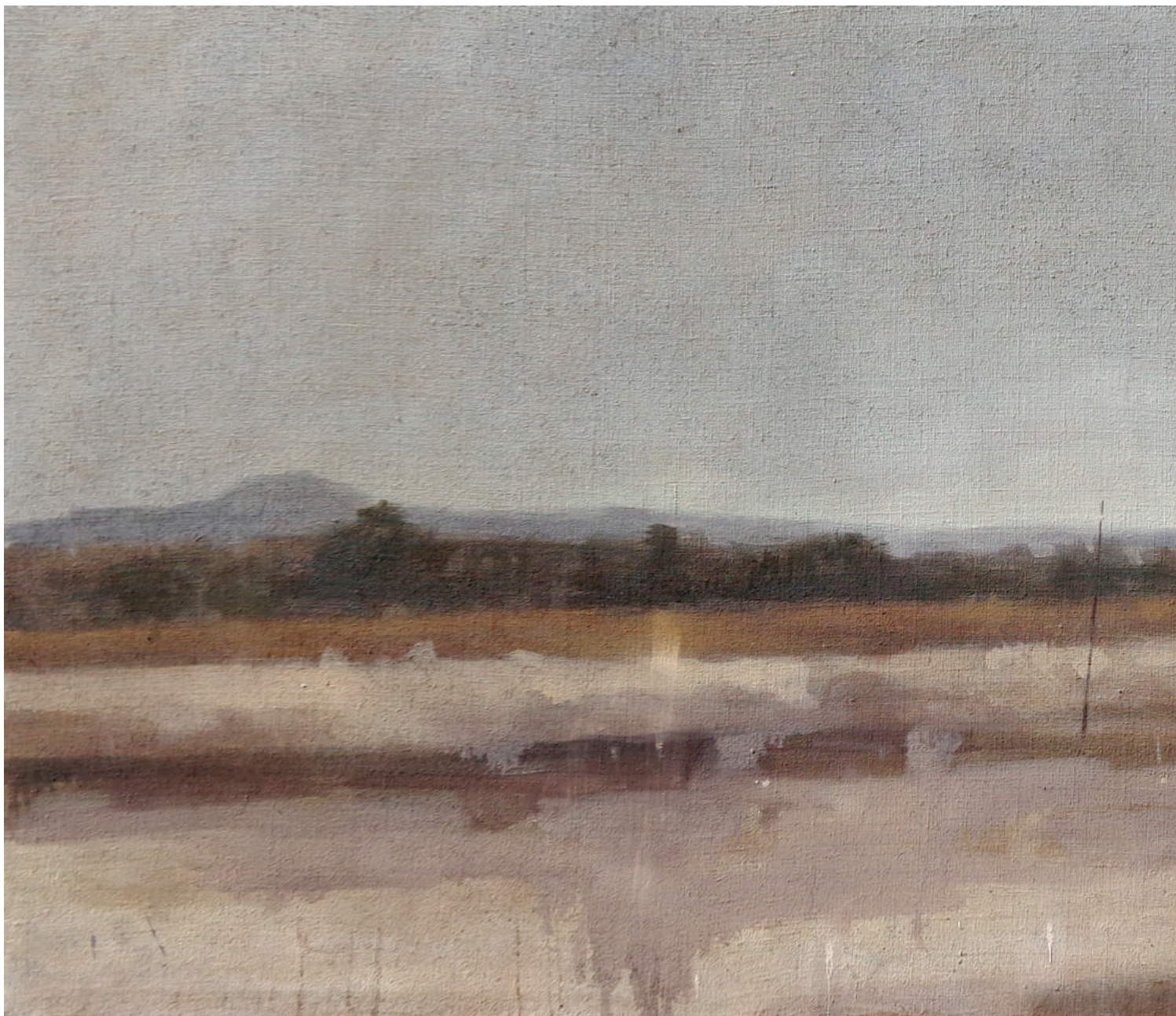
Studio di marina, 2016, olio su tela, cm 96x220