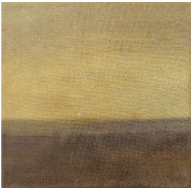
Crepuscolo, 2016, olio su tela, cm 15x15