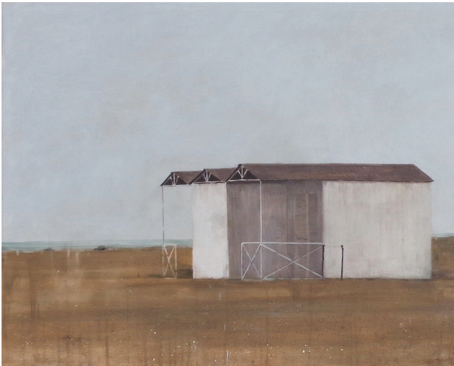
Cabine al Cinquale, 2016, olio su tela, cm 82x200