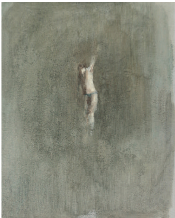
Figura sospesa, 2016, olio su carta, cm 13x16,5