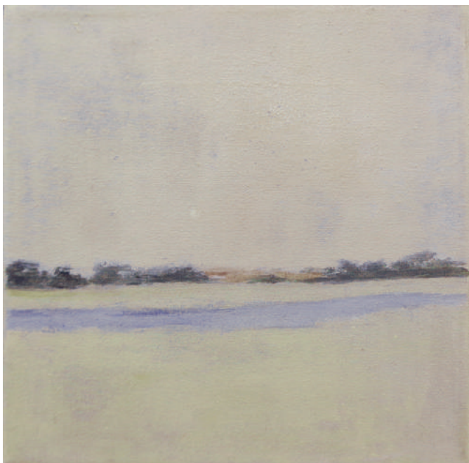
Studio di paesaggio, 2016, olio su tela, cm 15x15