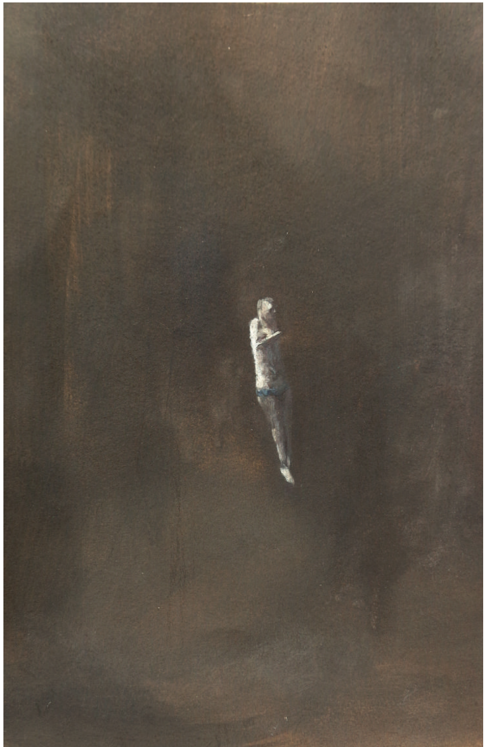
Tuffo, 2006, olio su carta, cm 29x19,5