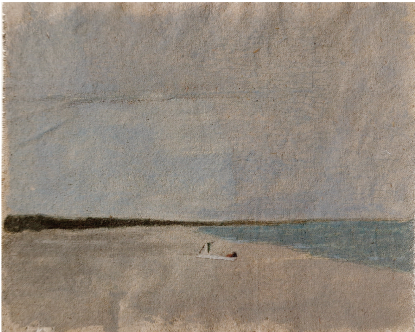
Il bagno, 2016, olio su tela, cm 14x17